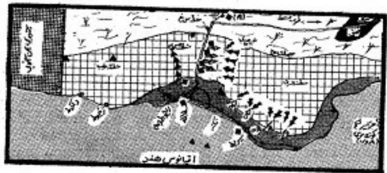
نقشه منطقه جنگ ظفار بعد از حمله ارتش ایران در دسامبر ۱۹۷۳.

رژیم شاه خیلی آسانتر از دولت امریکا یا انگلستان میتواندست چندین هزار سرباز به عمان بفرستد زیرا اشکالات داخلی ایکه چنین مداخله نظامی برای این دول میتواندست ایجاد کند برای رژیم شاه وجود نداشت. بعلاوه رژیم شاه علاقمند بود که از طریق این مداخله نظامی نفوذ خود را نسبت به