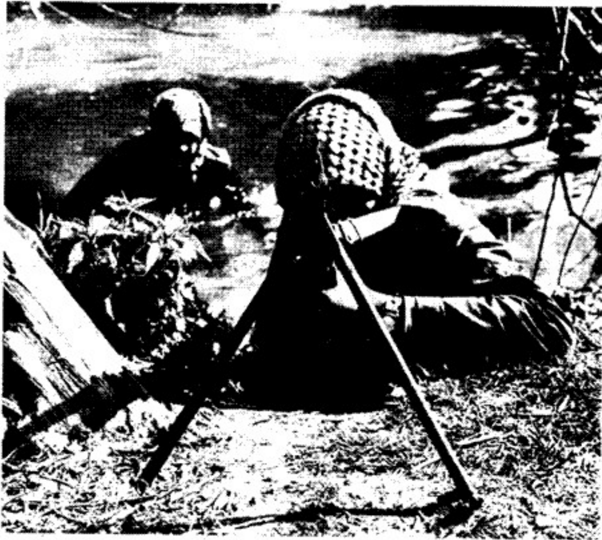
چیزی که به الفتح محتوای انقلابی را می داد این بود که در عمل مبارزه مسلحانه بر علیه دولت صهیونیستی را رهبری می کرد.

در عرض نیمه دوم سال ۱۹۶۸ و تمام سال ۱۹۶۹ و بیشتر سال ۱۹۷۰ فدائیان فلسطینی پاسداران مرزی و نیروهای اشغالگر اسرائیل را هر روز مورد حمله قرار داده تلفاتی وارد مینمودند که از لحاظ تعداد برای کشوری که جمعیتش فقط در حدود ۳ میلیون میباشد بهیچوجه ناچیز نبود. قدرت جلب الفتح (و سازمانهای دیگر