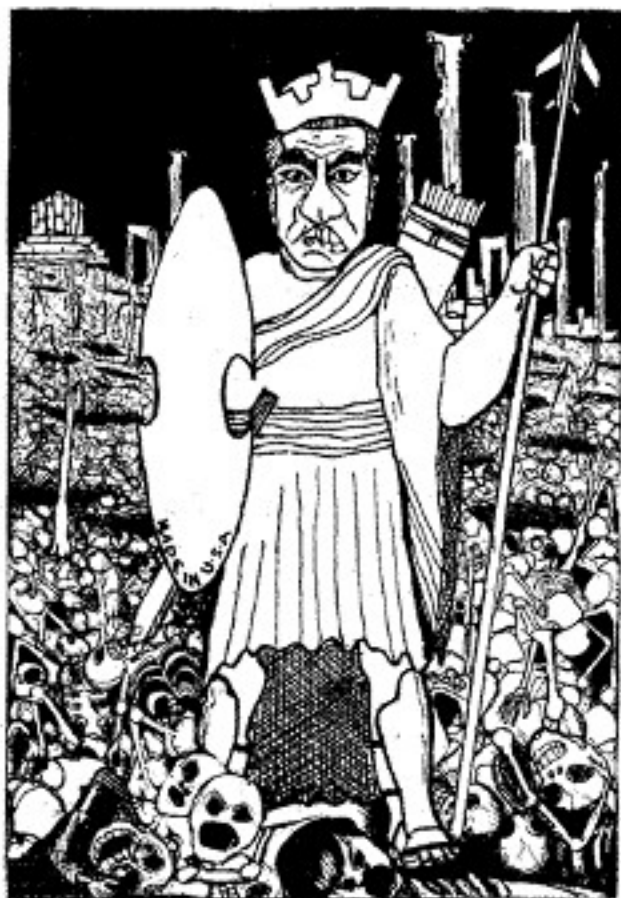
* کوروش! آسوده بخواب که ما بیداریم *

از تغییر کامل استراتژی گئی امپریالیزم، بسبب فروش فزاینده زیادی از مدرن ترین سلاحهای غیرانحصاری خود را به ایران شروع کرد. برنامه وسیعی برای تقویت قوای نظامی ایران که شامل تجهیز آن با بهترین سلاحها، دادن تعلیمات نظامی به افسران ایرانی از طریق هزاران مستشار امریکائی که در ایران بودند، و با از طریق اعزام افسران ایرانی به امریکا، اسرائیل، و انگلستان، و تا سیرویا لیبیهای نظامی بزرگ و مدرن می بود، شروع شد. در عرض چند سال قوای نظامی ایران، بخصوص نیروی هوایی و دریائی از یک قوای ضعیف و با اسلحه هائی کهنه به یک نیروی قوی و مجهز به مدرن ترین سلاحها تبدیل شد. تغییر مرکز ثقل ارتش ایران از مناطق